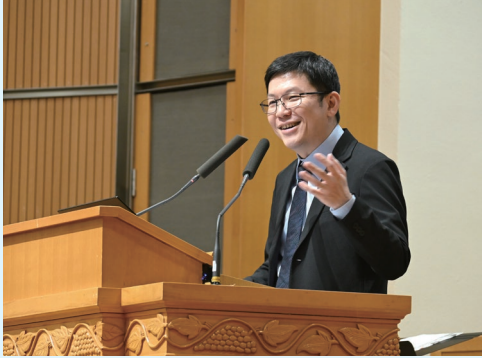
成興榮老師分享信息。