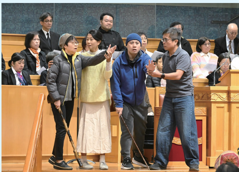
讀經與默劇交錯進行， 增加經文的震撼力。