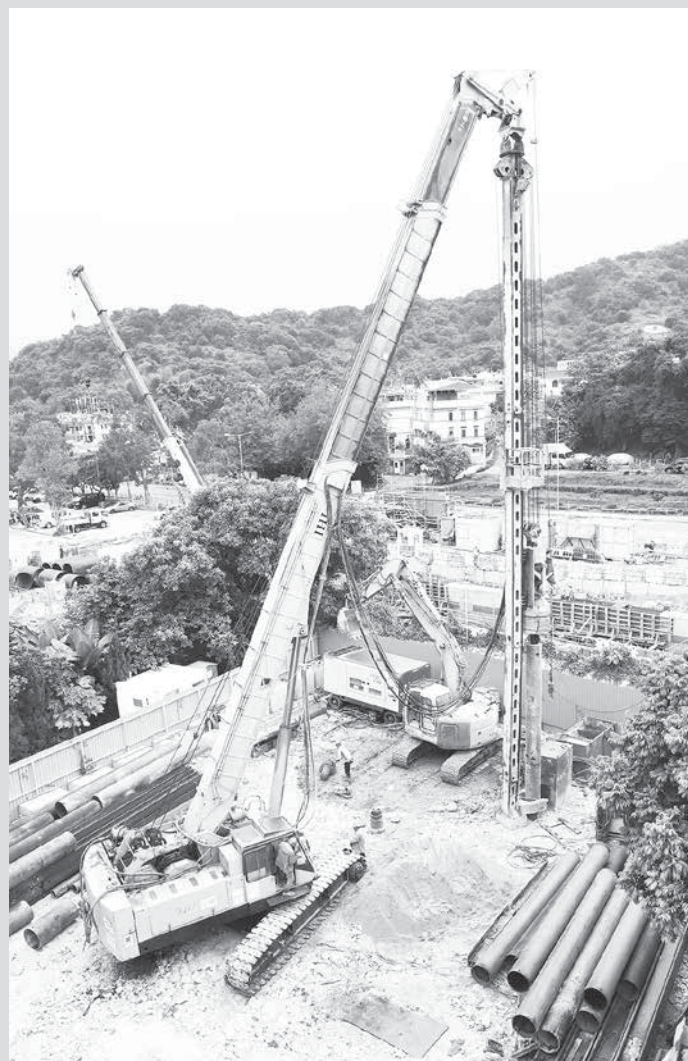
工地上正進行新大樓地基打樁的預備工程。