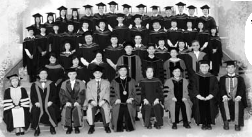
第五十八屆畢業生與師長合照