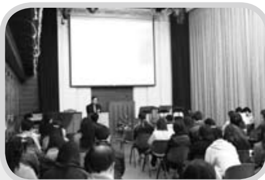
在神學生生活體驗營探索神的呼召

此外，本院的夏季密集課程將於5月下旬開始上課，當中有聖經科目及教牧輔導科目，歡迎教牧同工及弟兄姊妹旁聽。如有查詢，請致電2768 5129或瀏覽本院網頁。