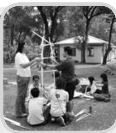
「青少年導師訓練文憑課程」 的戶外課堂

畢業生的回應是我們的動力！期望藉著神的恩典，本部能與眾教會攜手並肩，繼續關心我們的青少年，努力培育他們成為天國精兵。