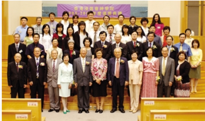
主禮人、捐獻者、得獎同學、獲長期服務獎的老師及同工、榮休同工於典禮後拍照。